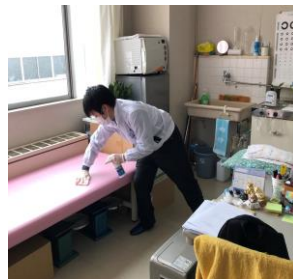
保健室・トイレ個室 （スポットコーティング）