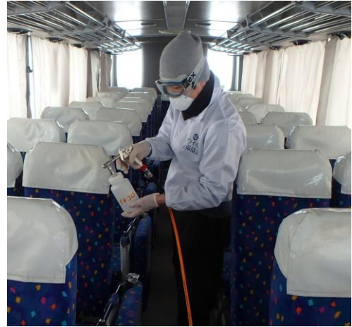
スクールバス（まるごとコーティング）